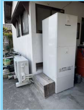
エコキュート交換後